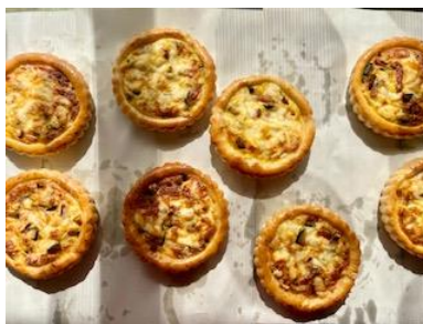
かぼちゃとベーコンのキッシュ