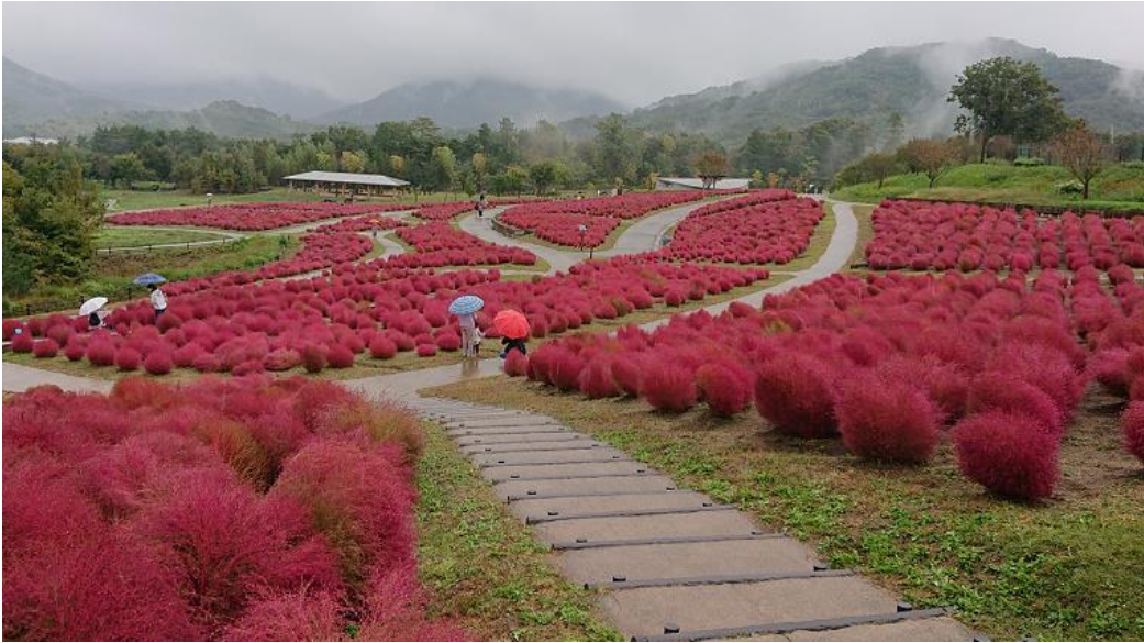
まんのう公園のコキア 地域医療連携室 村上 愉美子